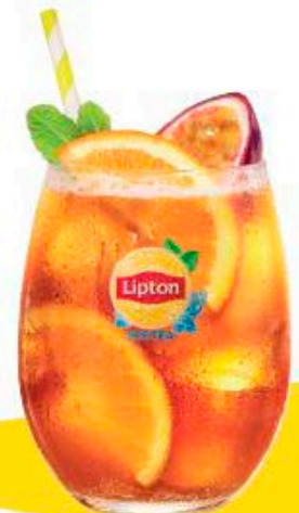
SPARKLING PASSION FRUIT with a twist