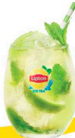
VIRGIN MOJITO with a twist