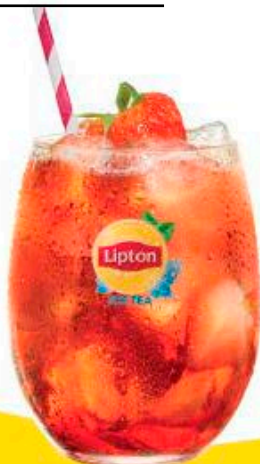
PEACH STRAWBERRY with a twist