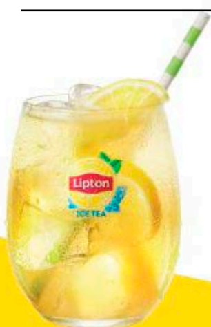
GREEN YUZU with a twist